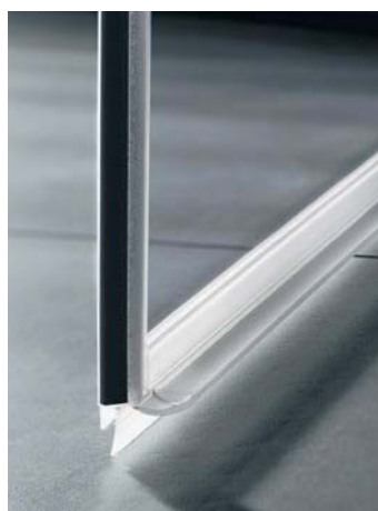
Die spezielle waagrechte Kermi-Dichtleiste mit Wasserabpralleffekt sorgt für zufriedenstellenden Spritzwasserschutz.