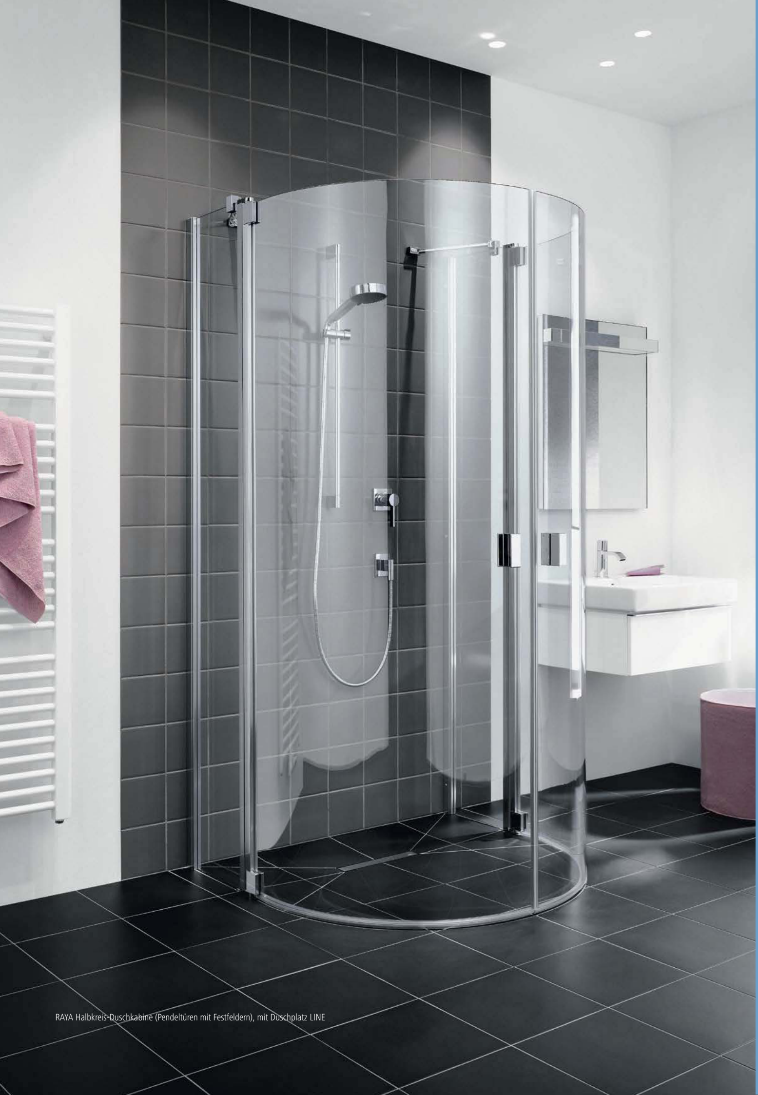
RAYA Halbkreis-Duschkabine (Pendeltüren mit Festfeldern), mit Duschplatz LINE