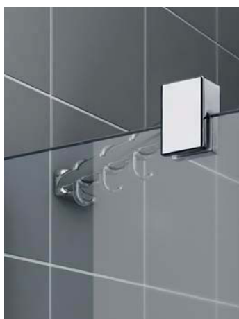
Festfelder und feststehende Seitenwände mit eleganter RAYA-Stabilisation mit Zusatzfunktion. Zum griffbereiten Aufhängen der Duschtensilien.