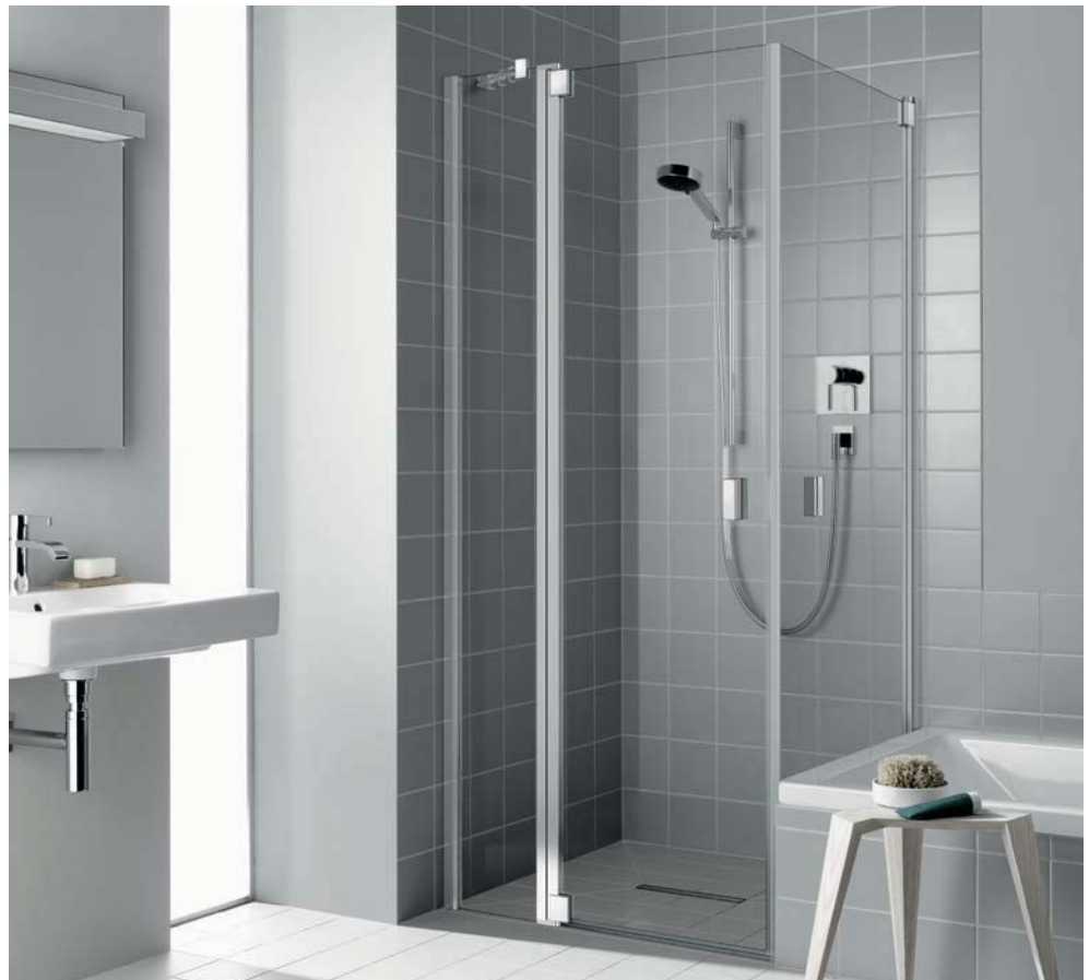
RAYA Pendeltür 1-flügelig mit Festfeld und beweglicher Seitenwand geschlossen, mit Duschplatz LINE