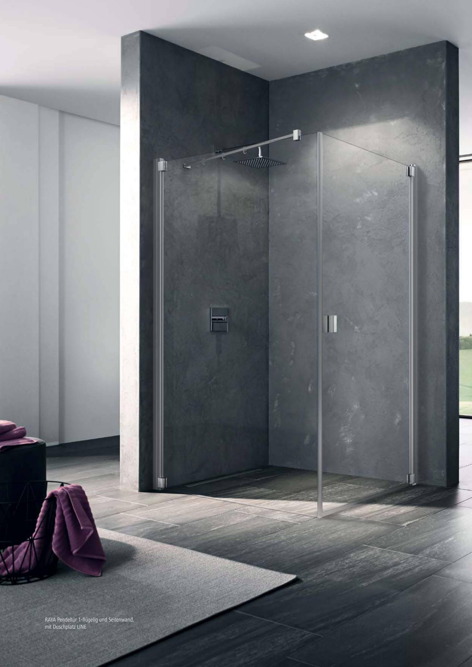
RAYA Pendeltür 1-flügelig und Seitenwand, mit Duschplatz LINE