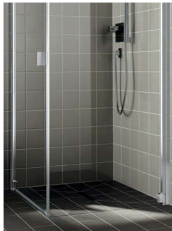
Eine feststehende Seitenwand für Pendeltür 1-flügelig und Pendeltür 1-flügelig mit Festfeld.