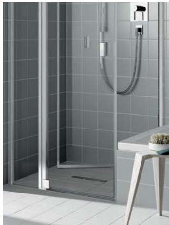
Bewegliche Seitenwand für Pendeltür 1-flügelig und Pendeltür 1-flügelig mit Festfeld. Mit zusätzlichem RAYA-Griff innen als Serienteil statt Maßanfertigung. Für problemlose Reinigung und optimale Entlüftung nach innen schwenkbar.