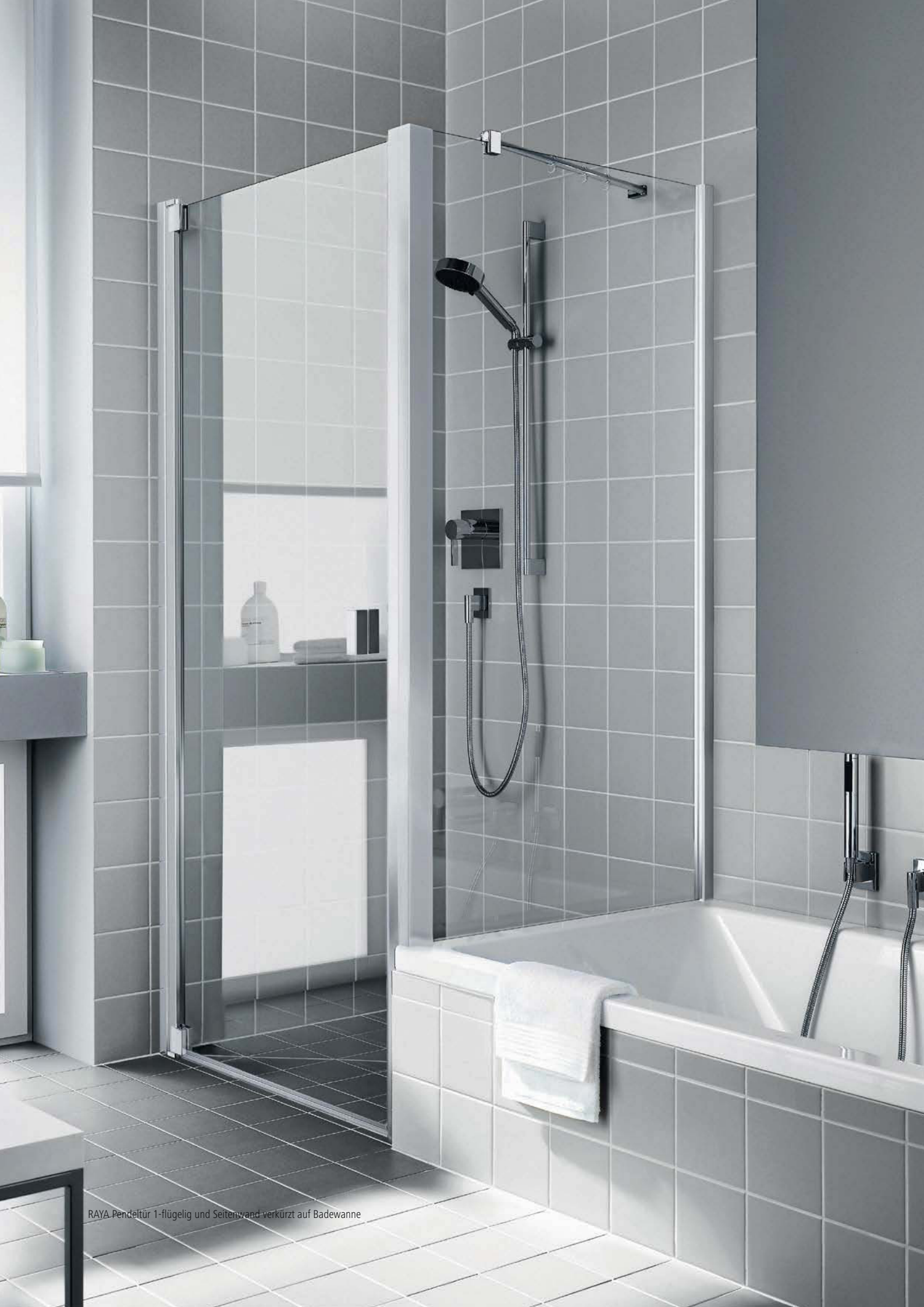
RAYA Pendeltür 1-flügelig und Seitenwand verkürzt auf Badewanne