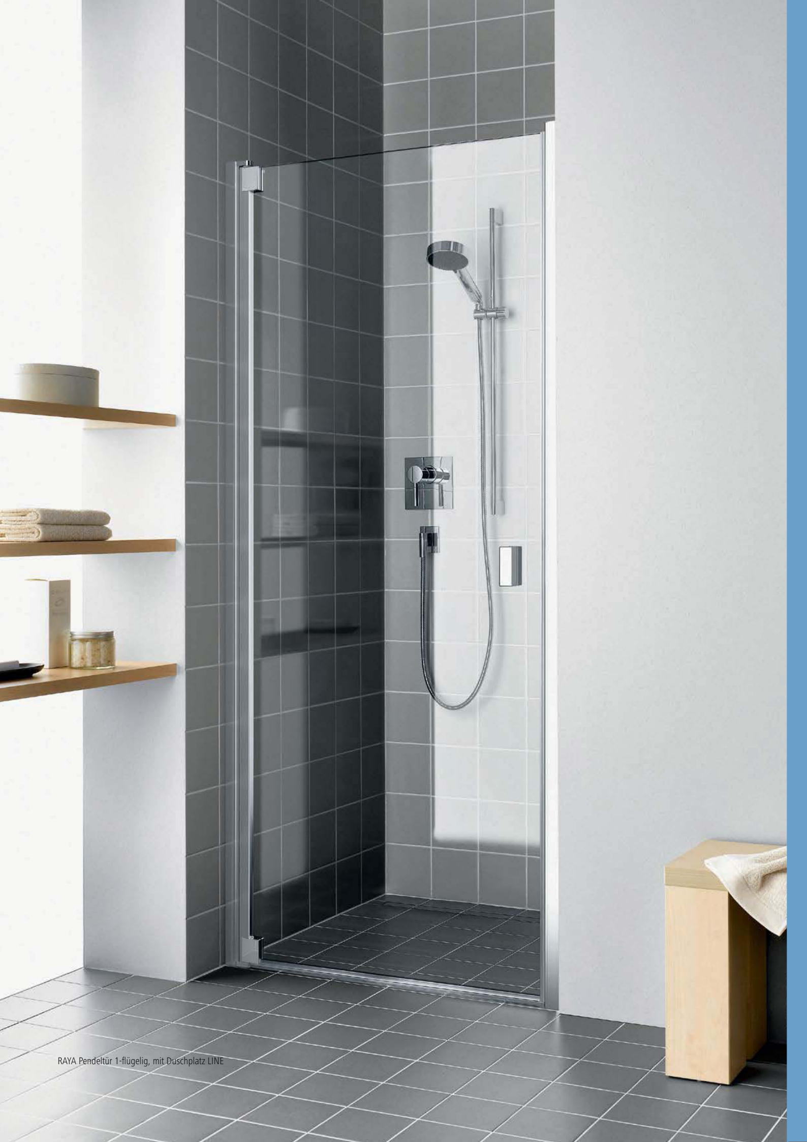
RAYA Pendeltür 1-flügelig, mit Duschplatz LINE