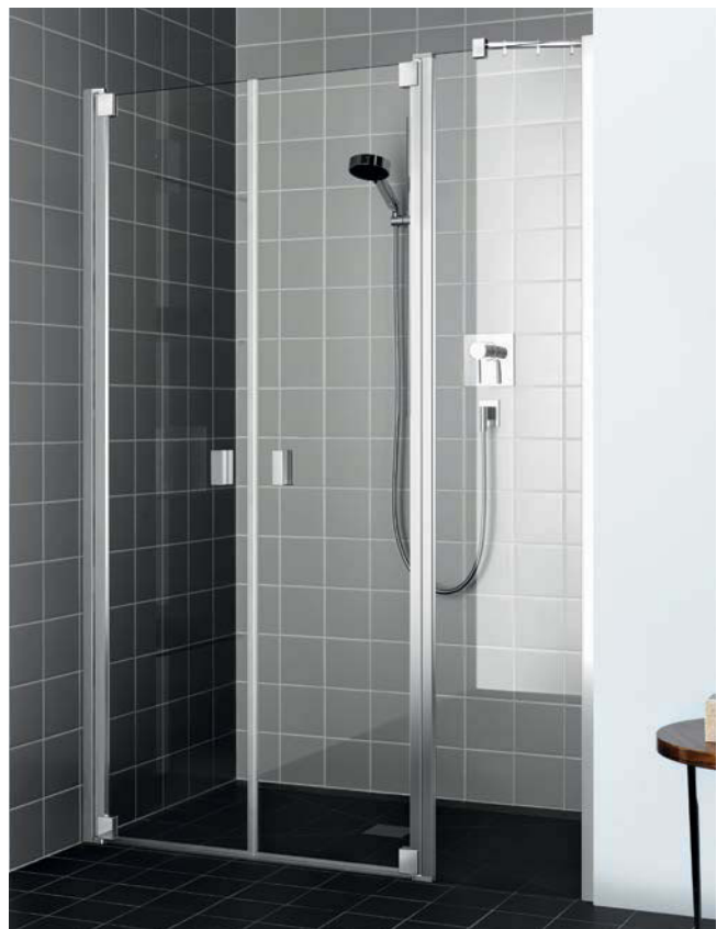
Oben: RAYA Pendeltür 1-flügelig mit Streifdichtung, mit Duschplatz POINT