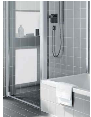
Eine feststehende Seitenwand und eine feststehende Seitenwand verkürzt auf Badewanne zur beliebigen Kombination mit allen weiteren Türen und U-Kabine.