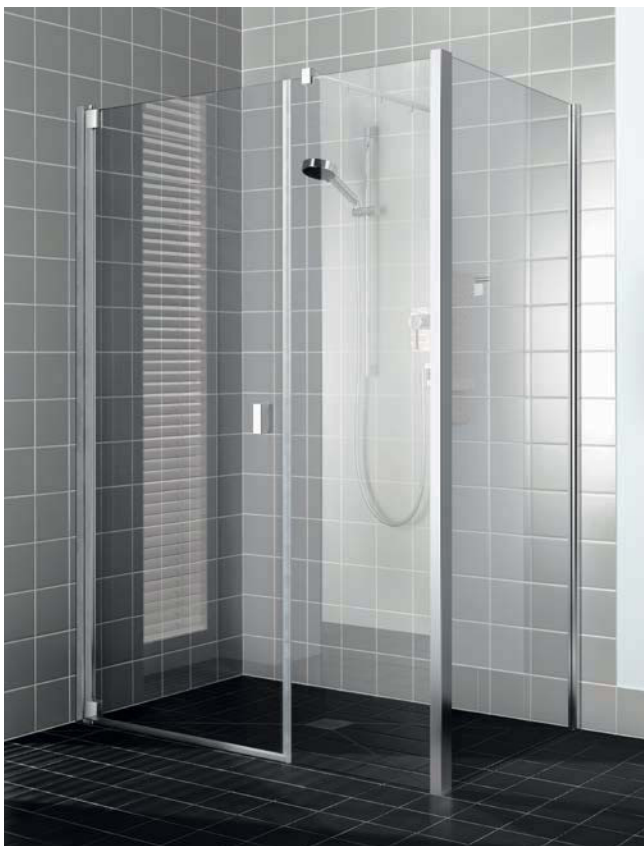
RAYA Pendeltür 1-flügelig und Festfeld und Seitenwand, mit Duschplatz POINT