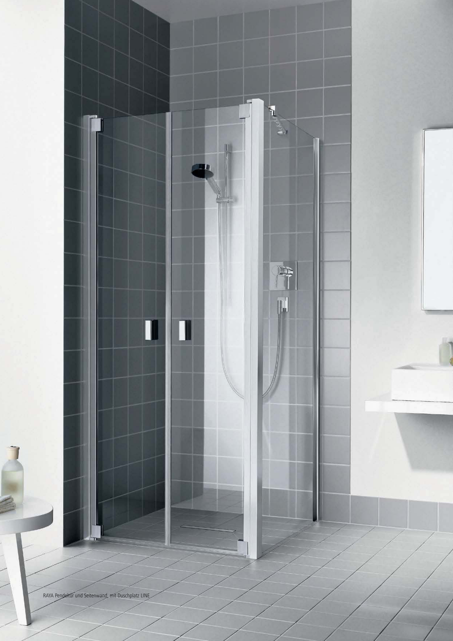
RAYA Pendeltür und Seitenwand, mit Duschplatz LINE