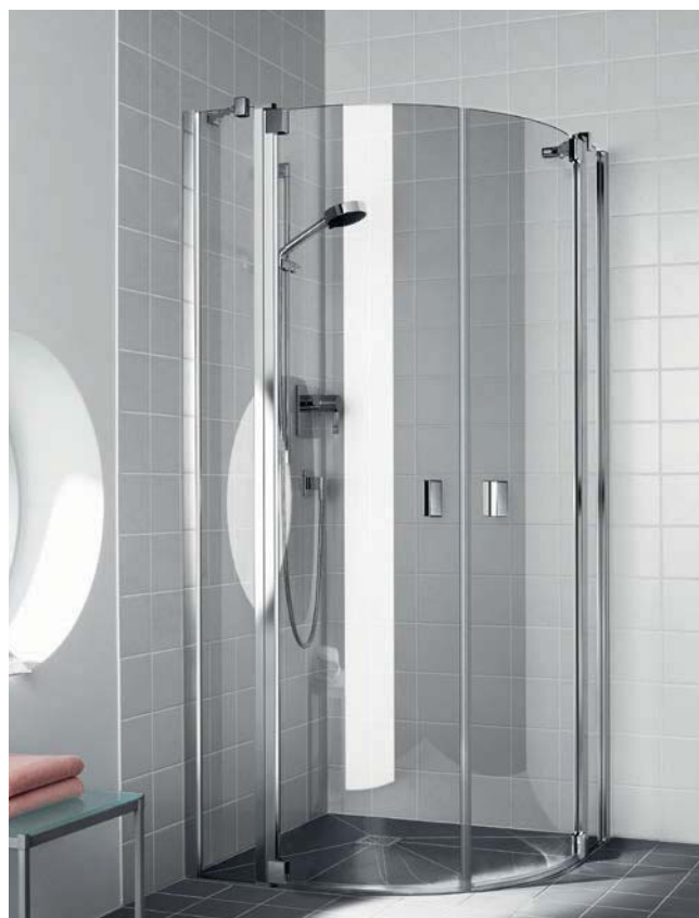
Oben: RAYA Eckestieg (Pendeltüren), mit Duschplatz LINE