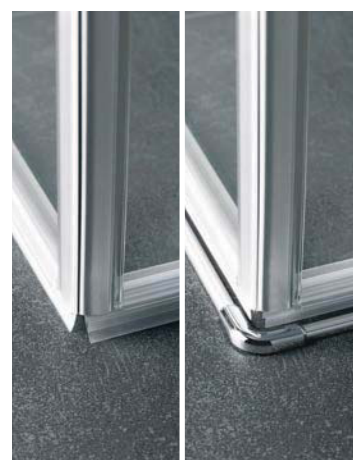
Alle Bauformen wahlweise montierbar ohne oder mit serienmäßiger 6 mm hoher Kermi-Bodenschwelle zur Verbesserung des Spritzwasserschutzes bei baulichen Gegebenheiten, auch nachträglich installierbar.