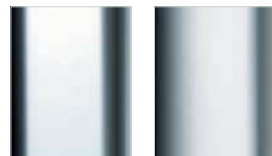
silber hochglanz silber mattglanz