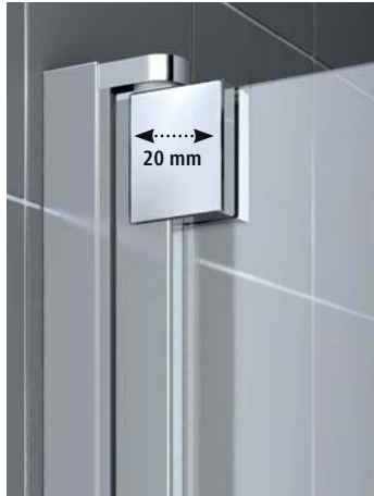
Elegante, schlanke Anmutung durch unsichtbaren Breitenausgleich in Tür- und Seitenwandbeschlägen.