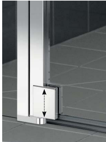
Funktionelle Feinheit: der feinjustierbare Hebe-Senk-Mechanismus der Pendelflügel für seidenweichen Türlauf und sanften Türschluss.