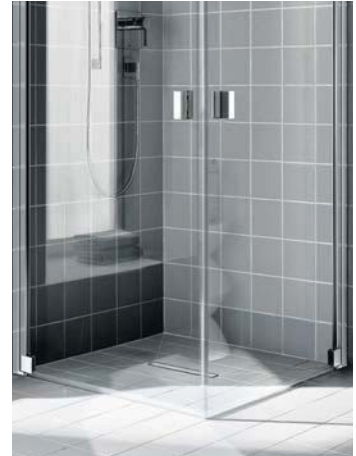
Alle Festfelder, Türflügel und Seitenwände waagrecht ungerahmt.