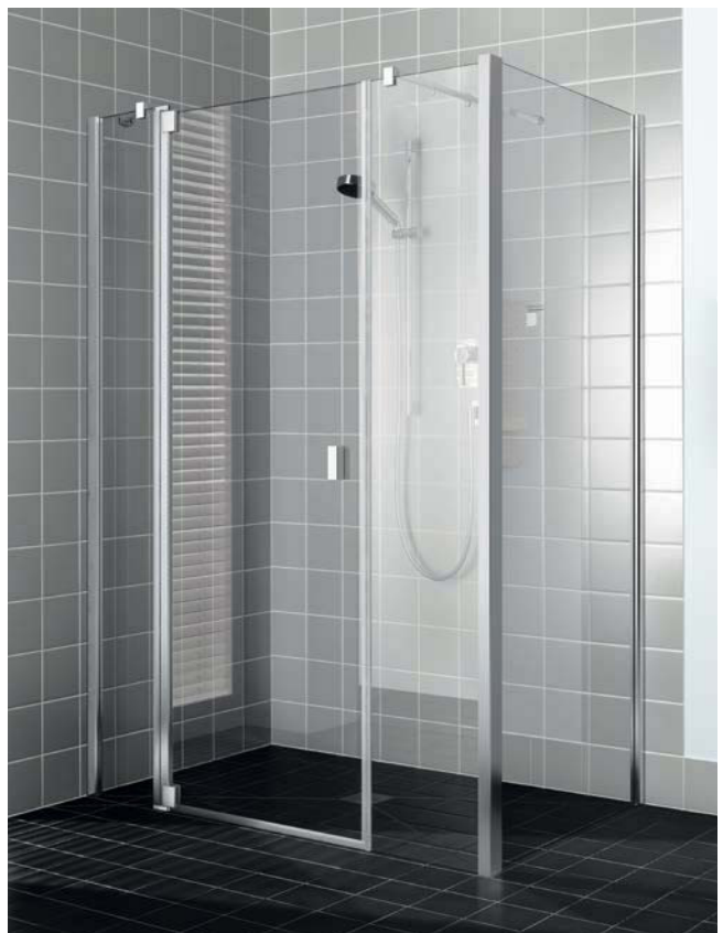
Oben: RAYA Pendeltür mit Festfeldern und Seitenwand, mit Duschplatz POINT