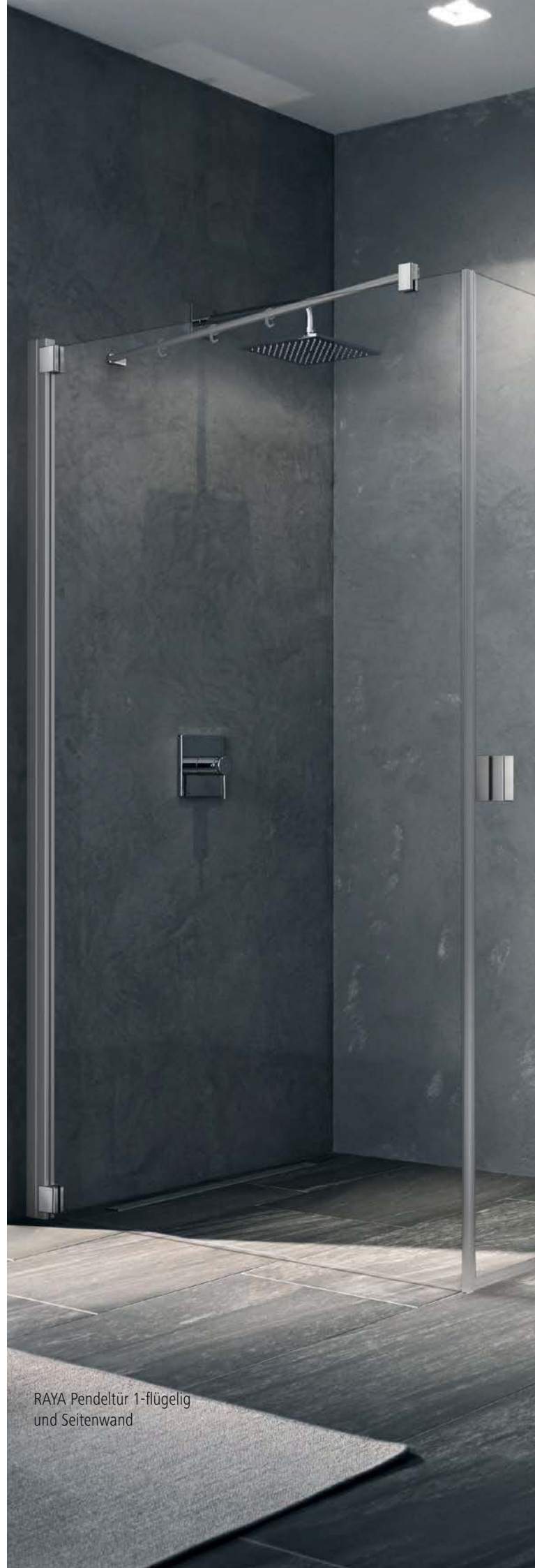
RAYA Pendeltür 1-flügelig und Seitenwand