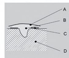
A = Polyester o. Cellophan-Folie B = Plexiglas Renova C = Klebeband D = Plexiglas SW Sanitärteil